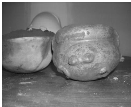
Fig. 3 ofrenda funeraria, entierro de infante.

A una profundidad de 105 cm, se recuperaron tres pequeñas vasijas, que formaban parte de la ofrenda funeraria del individuo, de cuyos restos óseos mal preservados únicamente quedaron dos piezas dentales correspondientes a