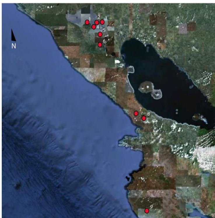
Fig. 2 Ubicación de sitios del periodo tempisque donde se han documentado contextos funerarios

En el pacífico de Nicaragua, el estudio de los patrones funerarios en el periodo Tempisque (500 a.c al 300 d.c.), ha estado relegado a investigaciones de salvamento (Moroney, 2010; García; 2006, Vásquez; 2009, 2011, Lange et al., 1996), lo que ha limitado el conocimiento sobre aspectos relacionados con el modo de vida y sus prácticas funerarias.