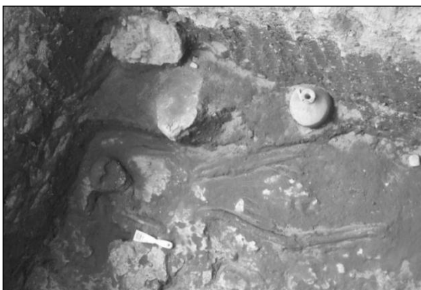
Fig. 4 entierro primario con ajuar funerario, destacándose un pedestal cerámico, olla globular v una vasiia trípode.

Entierro primario orientado en dirección Sur (el cráneo) - norte (los pies) a una profundidad de 1.04m, donde los restos óseos se encuentran muy