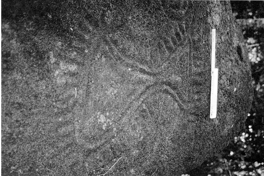
Abb. 4: Eine “sanduhrähnliche” Form vom Fundort Quebrada de Macho (Nancito).