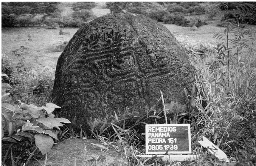
Abb. 5: Ein Petroglyphenstein, der unter anderem eine Bogenform aufweist (Cerro Valeria, Remedios).