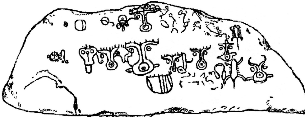
Abb. 2: "Piedra Pintal" bei Caldera. Südwestseite (aus: Holmes 1888: 22).