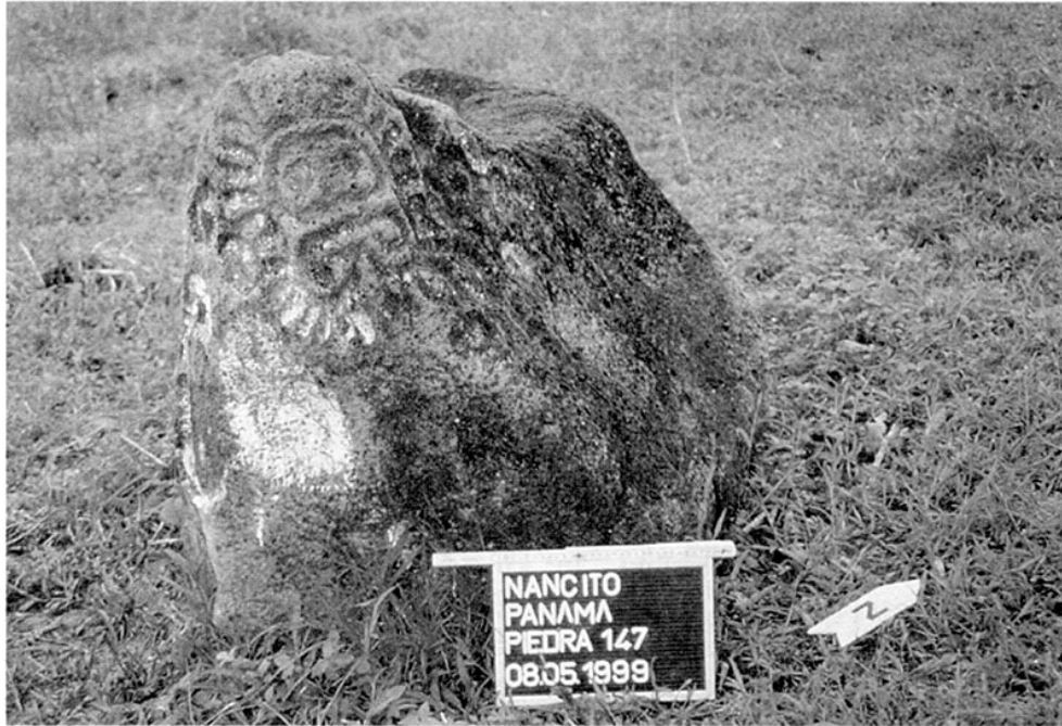
Abb. 6: Der Petroglyphenstein "La Leona" von der Finca Castellón (Nancito).