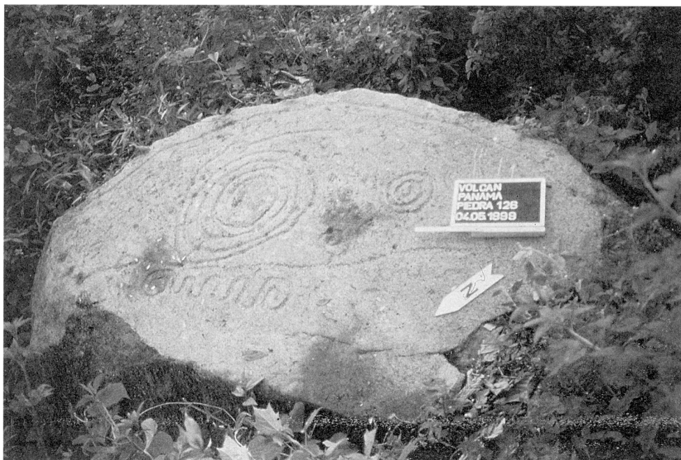
Abb. 3: Ein Petroglyphenstein von der Finca Palo Santo bei Volcán.